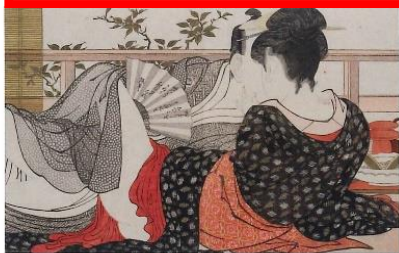
喜多川染包「歌まくら」天明4年(1788) 河上愛氏蔵

CHANEL NEXUS HALLにて、「ビエール セルネ & 春用」を期題、ビエールセルネの写実シリーズ「Synonyma」と、近年ますます世界的に注目を集めている日本の春画を展示。様々なカプルのモードを撮写としたセルネのモノクロ写真と、春画のユニークなコントラストを見ることが出来る貴重な機会となっている。 会期は3月13日～4月7日まで。(3月28日は休館) CHANEL NEXUS HALL TEL: 03 5779 4001